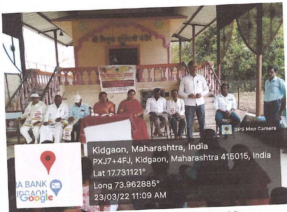
Farmer Participant expressing gratitude for the activity