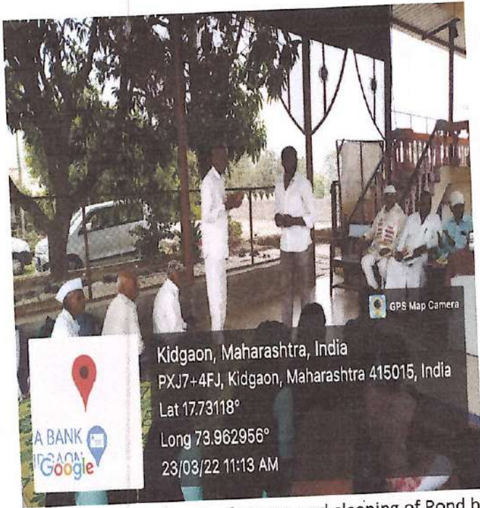
Felicitation of senior farmers and cleaning of Pond by students