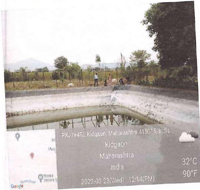
Students cleaning the farm pond