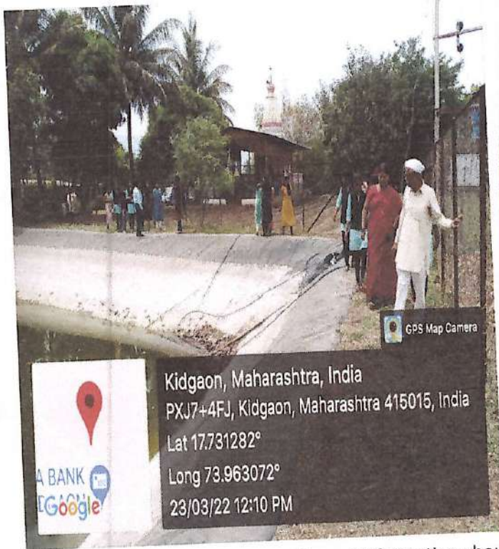
Students visited the farm pond to get information about size, material, technique, piping